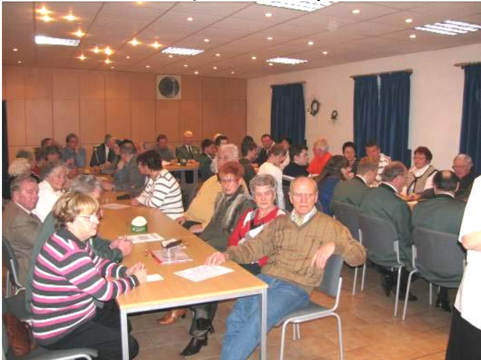
Bild: So gut gefüllt wie auf dem Foto der JHV 2009, so möge es auch in diesem Jahr wieder sein.

Am 6. Februar ist Jahreshauptversammlung